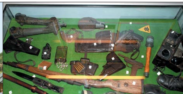
Aandachtrekkers. Altijd. Allemaal.

Nu levende ooggetuigen van de bezetting en de bevrijding in rap tempo in aantal afnemen, is het goed dat er musea als het MHM zijn. Het hoeft namelijk niet altijd